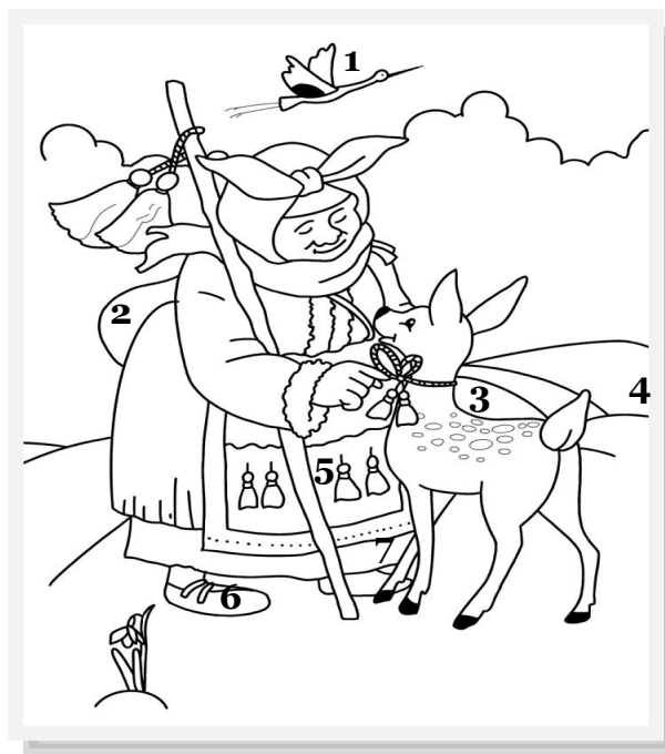
Илюстрации: Петър Цветков - X и клас