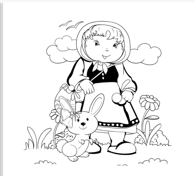
Илюстрации: Петър Цветков - XII И клас