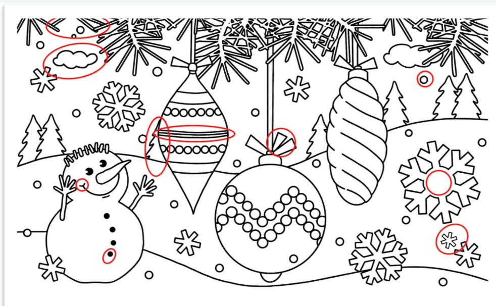
Илюстрации: Петър Цветков - XII и клас