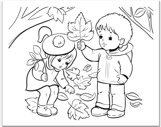
Илюстрации: Петър Цветков - XII и клас